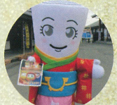
東秩父村マスコットキャラクター わしのちゃん