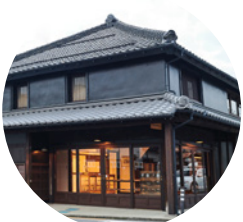
氷川神社 旭舎文庫